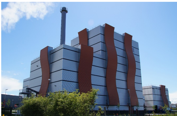
SODC anlægget i Orleans er et biomassefyret anlæg på 37 MWth.